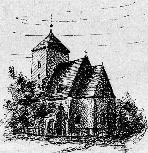
Kirche zu Sachsenau

erfolgte, urkundlich genannt. Als in der Folgezeit die schlesischen Herzöge anfangs einzelne Hufen, später Dorfanteile und schließlich ganze Dörfer als Lehnbesitz an ihre Ritter vergaben, die dadurch Grundherren wurden, erhielt auch Langewiese seine adligen Obereigentümer, so daß schließlich zwei Dorfanteile verblieben. Diese bestanden als selbständige politische Gebilde bis zur Auflösung der mittelalterlichen Agrarverfassung um die Mitte des 19. Jahrh. und vereinigten sich dann zu der politischen Gemeinde Langewiese. Aber bis in unsere Tage unterschieden die Grundbuchblätter und Katasterunterlagen in Langewiese Grundstücke herzoglichen und königlichen (geistlichen) Anteils.